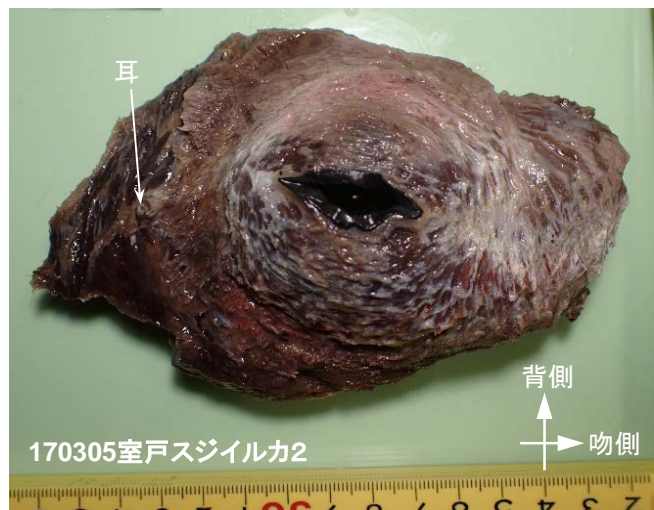
図1. 眼輪筋(右眼). 筋線維は赤色を呈するが腱は白色を呈する。

スジイルカ4頭の眼輪筋の上眼瞼部の一部に筋線維ではなく腱があることが確認された。一方、下眼瞼部は全て筋線維であり、上眼瞼部に見られたような構造は無かった(図1)。本研究から、ハクジラ類の中で少なくともスジイルカとイシイルカの上眼瞼部の一部には腱があることがわかった。また、脂皮を剥離する前のスジイルカとイシイルカの上眼瞼には、水平方向に走る溝がある(図2)。この溝がある場所は、上眼瞼に腱が確認された場所とほぼ一致する。