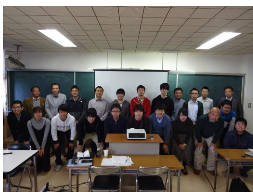
写真1. 参加者の集合写真

本ワークショップは、関連する学会や会合、観測航海等の開催が少なく、比較的多くの参加者を見込める、かつ若手育成の観点から卒業論文、修士論文や博士論文の内容がある程度固まっていた実践的な議論をしやすい11月から12月の間を狙って開催した。また、参加者が日程を確保しやすいよう、早めに開催通知を行った。しかし、どの時期に設定しても他の複数の会合と会期が重なってしまった。参加者は決して少なくはなかったが、本ワークショップの元々の趣旨である、多様なバックグラウンドを有する関係者が一堂に会して議論することでこの分野のブレークスルーを喚起する目的は完全には達成できなかった。上述のように、今回の参加者を中心に、このワークショップの継続開催を望む声は強く、次回以降の開催に向けて会期の適切な設定が課題である。