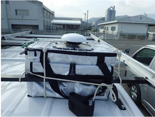
図 1 停車中のルーフ部に設置した，参照の GNSS 地上局

森漁港の西方の洋上で、「いさな」から GNSS-R 高度計を搭載したドローン（図 2 左）を離発着させ、高度 10～30m 程度で 6～7 分間ホバリングさせる観測を、潮時の異なる 9:30, 11:40, 12:25, 15:35, 16:30 の合計 5 回行った。計測時には、参照用に GNSS 受信機を入れた浮体と、波高計測用のブイも放流した（図 2 右）。上向きと下向きの各々の受信機の設定は、地上局と同じである。観測地点は、陸上の参照局からの基線長が長くなり過ぎないように 3～8km 程度とした。なお、船上でドローンを離発着させるためのテスト飛行は 7 月 26 日に行った。