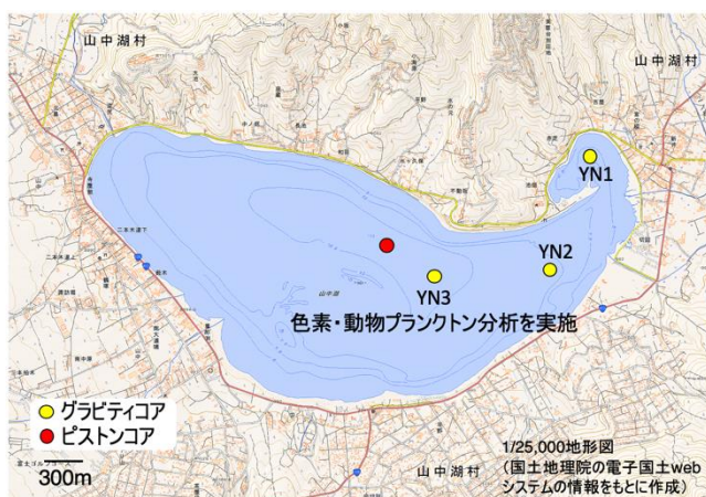
図 1 底質試料の採取地点

本研究では、山中湖における近年の底質汚濁傾向を明らかにするために、昨年度グラビティコアラーで採取した柱状試料（YN3；図1）の鉛-210、鉛-214、セシウム-137の放射能強度を測定し、堆積物の堆積年代を推定した。また、堆積物コア