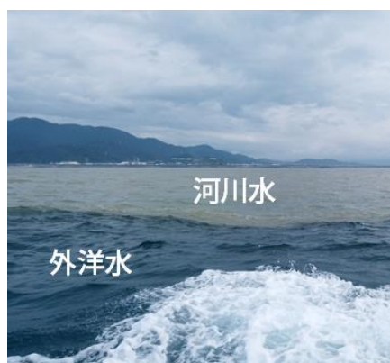
写真 1 駿河湾で観測された外洋水と河川水との間に形成された塩分フロント。

駿河湾において望星丸と南十字によって現場観測を行った。特に南十字では 30 \text{ mm day}^{-1} を超える降水量を記録した数日後に富士川沖（図 1b）で現場観測を行った。その結果として、湾外から流入した外洋水と陸域から供給された河川水との間に形成された塩分フロントを捉えることに成功した（写真 1）。以上のことから、東海大学の立地と調査船を最大限に活用することによって、駿河湾において“地の利”を生かした現場観測を行うことが可能であることを確認した。