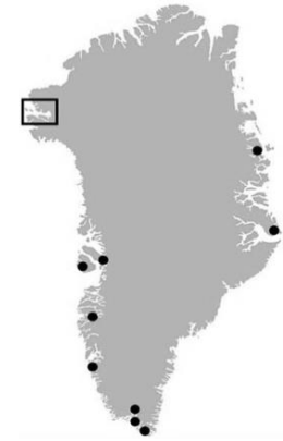
図1：本研究の対象地 ● 先行研究(Legacy POPs)

採取したサンプル2gを用いて、ポリ塩化ビフェニル(PCBs)やジクロロジフェニルトリクロロエタン(DDT)等のLegacy POPsの濃度を測定した。分析は、既法(Kunisue et al. , 2021)に従い、試料を高速溶媒抽出装置で抽出した後、ゲル浸透クロマトグラフィーおよび活性シリカゲルクロマトグラフィーで精製・分画する。分画して得られた最終溶液をガスクロマトグラフもしくは液体クロマトグラフ質量分析計を用いて定性・定量し、試料(アザラシの脂肪・餌生物の全身)1gあたりのPOPs濃度を算出した(図2)。